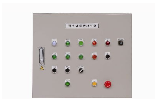
脱水部制御盤(PL法厳守)

厨芥処理システム/プランからメンテナンスまで アクターライン工業株式会社 〒565-0836 吹田市佐井寺4丁目3番8号 TEL (06) 6389-0428 (代表) FAX (06) 6389-0439 E-mail: honsha@acterline.com ACTERLINE (旧社名 関西技研工業株式会社)