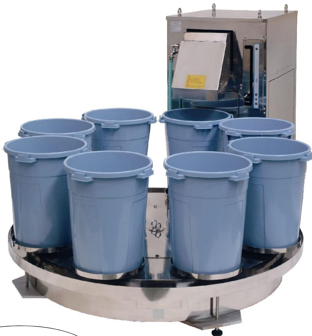
オートチェンジャー (ポリバケツ交換装置)

比較: 生ごみの容積(生ごみの山の頂上)を光電センサーで検知する方式では、バケツごとの重さが一定にならない