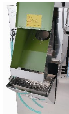
固形物回収バスケット付洗浄シュート