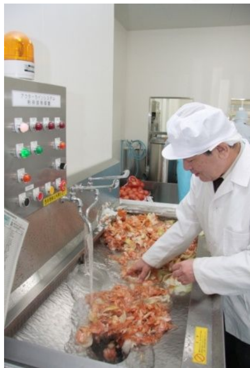
たまねぎの薄皮がどんどん投入できます