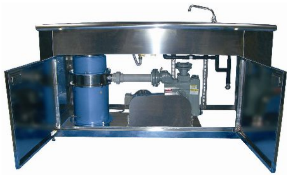
トラフテーブル(粉碎ポンプユニット)