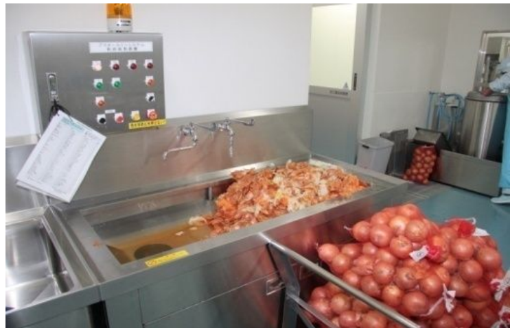
当日のたまねぎは320kgです