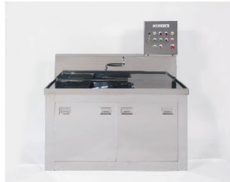
トラフテーブル外観