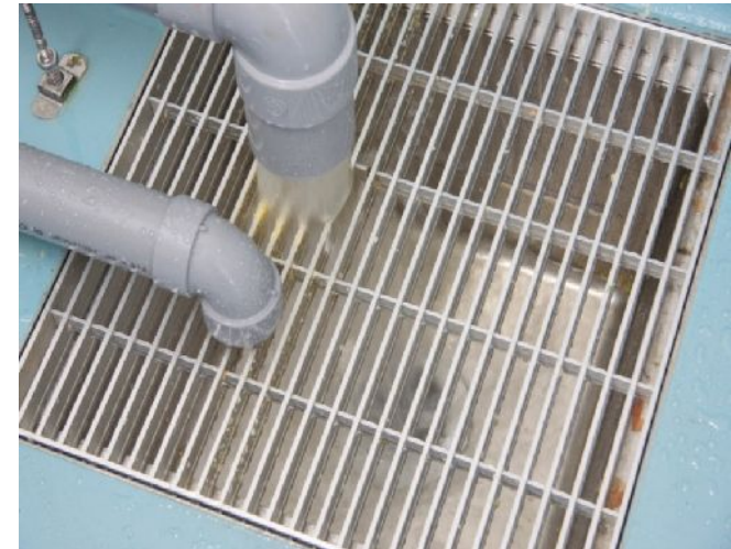
排水がきれいです