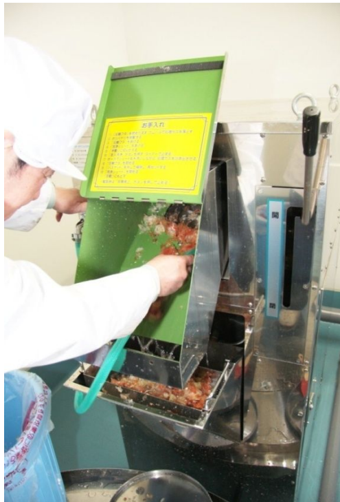
処理かすを排水に流しません