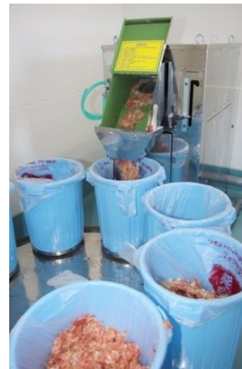
溜まる重さが均一です