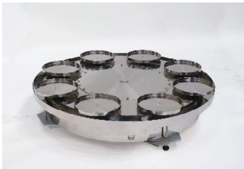
重量検知式オートチェンジャー(ポリバケツ交換機)