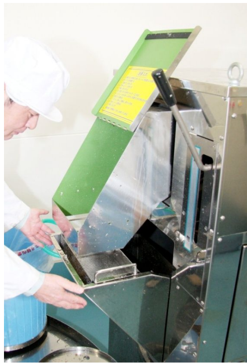
バスケットは洗浄シュートに収納