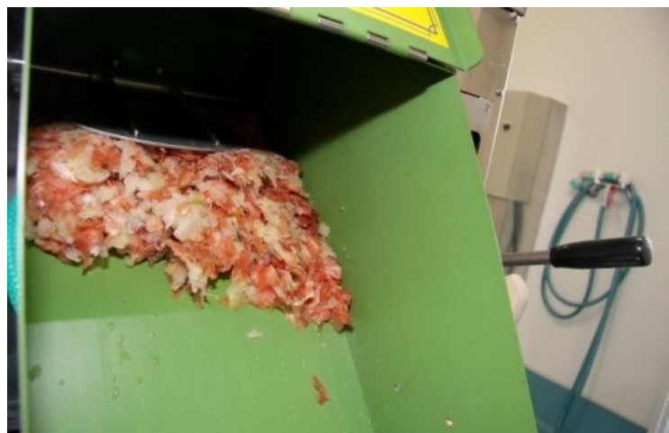
らくらく排出されてゆきます