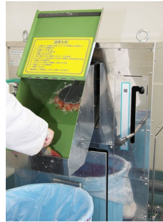
洗浄シュートは本体にピッタリ収まります